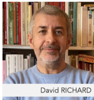
David RICHARD Auteur et réalisateur des entretiens filmés

Parce les archives sont rarissimes, une gamme inédite d'entretiens visuels menés auprès des personnalités entourant la Parfumerie, sont constitués par le Fonds de dotation Per Fumum. Telle une « capsule temporelle », destinée aux générations futures pour nourrir la connaissance de l'histoire de la parfumerie, Héritage(s) a pour but de constituer une mémoire immatérielle, humaine et vivante de ceux qui ont créés les parfums ou qui ont concouru à leur existence, voire à leur évolution.