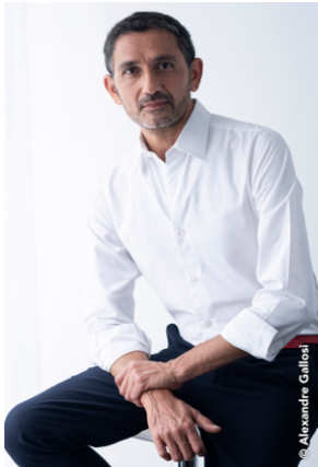
Francis KURKDJIAN Président

Le Conseil d'Administration : Il définit les orientations politiques et sélectionne les projets dont la mise en oeuvre et le suivi sont assurés par la Déléguée Générale.