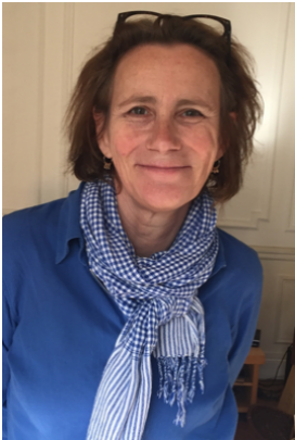
Marie DESPLECHIN Ecrivaine et Journaliste Médiation & Création littéraire

Les personnalités qualifiées : Par leurs expertises, elles apportent un soutien précieux au Fonds de dotation Per Fumum.