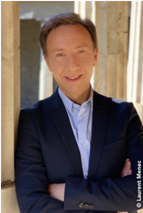
Stéphane BERN Restauration & Patrimoine